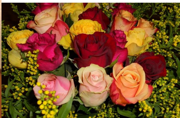
おめでとうございます。26 年間、地域の主任児童委員を務め、活動されました。