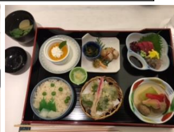
例会時のお食事 綺麗な松花堂弁当