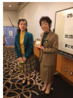
お誕生日の一言コメントを頂戴いたしました。