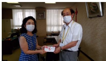
S クラブの活動 学校 HP より